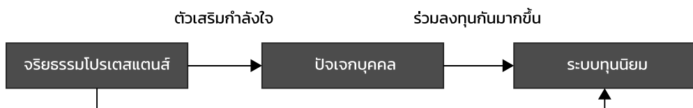
ภาพที่ 4 ผังความสัมพันธ์ระหว่างจริยธรรมโปรเตสแตนต์ ปัจเจกบุคคล และทุนนิยม

ในการอธิบายปรากฏการณ์ดังกล่าว เวเบอร์ เลือกจริยธรรมของศาสนาที่มีชื่อเสียงของโลก 6 ศาสนา ได้แก่ ขงจื้อ ฮินดู พุทธศาสนา คริสเตียน อิสลาม และยูดาเยน ที่มีความเกี่ยวข้องกับเศรษฐกิจมาวิเคราะห์ถึงธรรมชาติที่แท้จริงของจริยธรรมทางเศรษฐกิจที่มีอยู่ในแต่ละศาสนา และศึกษาความสัมพันธ์ระหว่างนิกายโปรเตสแตนต์กับลัทธิทุนนิยม โดยเลือกสิ่งที่เป็นตัวเสริมกำลังใจเพื่อให้คนมีกำลังใจทำงานซึ่งเป็นหัวใจสำคัญต่อความสำเร็จของระบบทุนนิยมมาสร้างแบบจำลองแห่งจริยธรรมต่างๆ (idea types of ethic) (ภาพที่ 4)