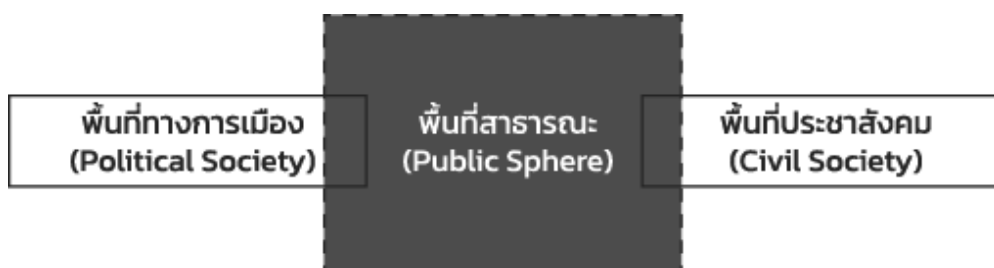
ภาพที่ 5 แนวคิดเรื่องพื้นที่สาธารณะ

ฮาเบอร์มาสเป็นหนึ่งในนักคิดสำนักแฟรงค์เฟิร์ต (Frankfurt School of Critical Theory) ที่โดดเด่นมากในครึ่งหลังของศตวรรษที่ 20 โดยแนวคิดมีทั้งลักษณะที่สืบทอดและต่อยอดจากนักวิพากษ์รุ่นก่อน เช่น การนำความคิดเรื่องพื้นที่ในสังคมของเฮเกลมาใช้ในการอธิบายเพิ่มเติมและอธิบายใหม่ด้วยแนวคิดเรื่องพื้นที่สาธารณะ ในความหมายถึงพื้นที่ที่อยู่กึ่งกลางและเป็นจุดเชื่อมต่อระหว่างพื้นที่ทางการเมือง (political society) และพื้นที่ประชาสังคม (civil society) โดยพื้นที่สาธารณะได้ถูกนำไปเชื่อมโยงกับเรื่องการมีส่วนร่วมทางการเมือง ในฐานะที่เป็นแกนหลักของสังคมประชาธิปไตยอย่างหนึ่ง และในฐานะที่เป็นองค์ประกอบที่สำคัญในการพัฒนาตนเองของปัจเจกชน (ภาพที่ 5)