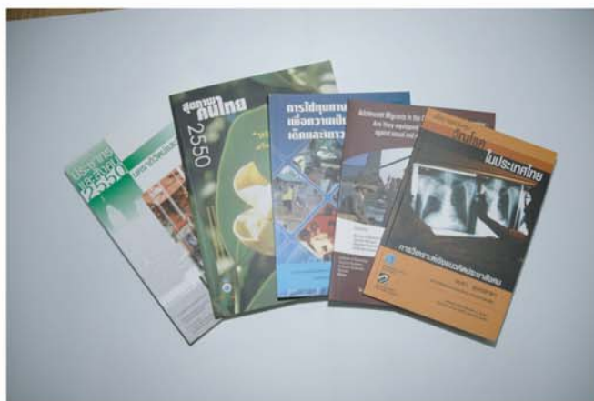
รายงานการวิจัย