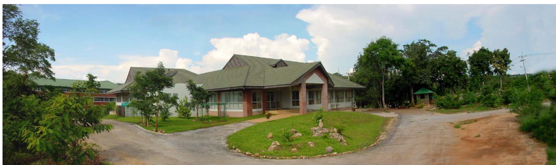
● อาคารศูนย์ปฏิบัติการวิจัย โครงการกาญจนบุรี

สถาบันวิจัยประชากรและสังคม มหาวิทยาลัยมหิดล ศาลายา