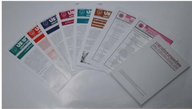
จดหมายข่าวประชากรและการพัฒนา สารประชากรมหาวิทยาลัยมหิดล และวารสารประชากรและสังคม