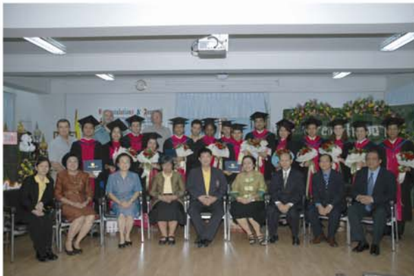
งานแสดงความยินดีแก่มหาบัณฑิต สาขาวิชาวิจัยประชากรและอนามัยเจริญพันธุ์ (หลักสูตรนานาชาติ) ในวันที่ 22 สิงหาคม 2550