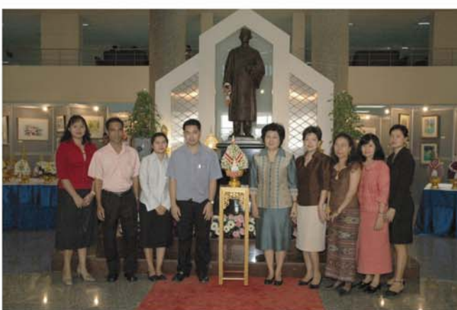
วางพานพุ่มถวายสักการะพระบรมรูปสมเด็จพระมหิตลาธิเบศรอดุลยเดชวิกรม พระบรมราชชนก ในวันที่ 2 มีนาคม 2550