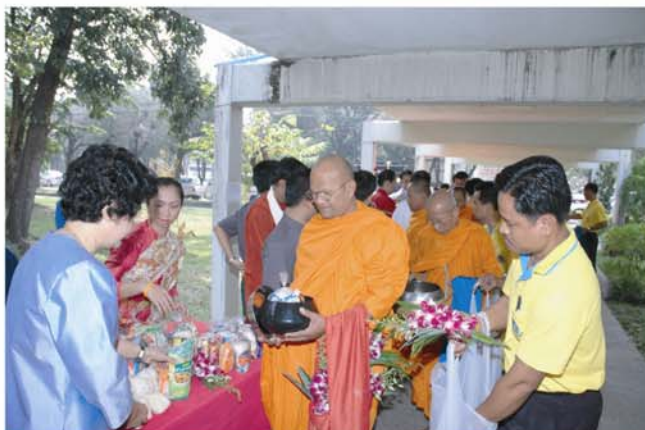
ทำบุญตักบาตรอาหารแห้ง เนื่องในโอกาสครบรอบ 35 ปีสถาบัน เมื่อวันที่ 14 พฤศจิกายน 2549