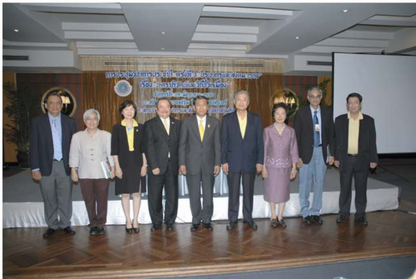
การประชุมวิชาการประจำปี "ประชากรและสังคม" ครั้งที่ 3 เรื่อง นคราภิวัตน์และวิถีชีวิตเมือง ในวันที่ 29 มิถุนายน 2550 ณ โรงแรมรอยัลริเวอร์