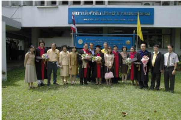
งานแสดงความยินดีแก่ดุษฎีบัณฑิต สาขาวิชาประชากรศาสตร์ (หลักสูตรนานาชาติ) และมหาบัณฑิต สาขาวิชาวิจัยประชากรและสังคม ในวันที่ 4 กรกฎาคม 2550