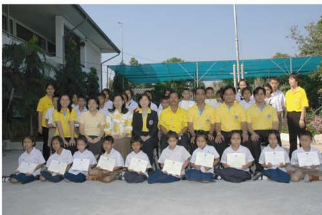
มอบทุนการศึกษาให้แก่เด็กนักเรียนโรงเรียนในเขตอำเภอพุทธมณฑล จำนวน 7 โรงเรียน เนื่องในโอกาสครบรอบวันก่อตั้งสถาบันฯ ให้เมื่อวันที่ 14 ธันวาคม 2549