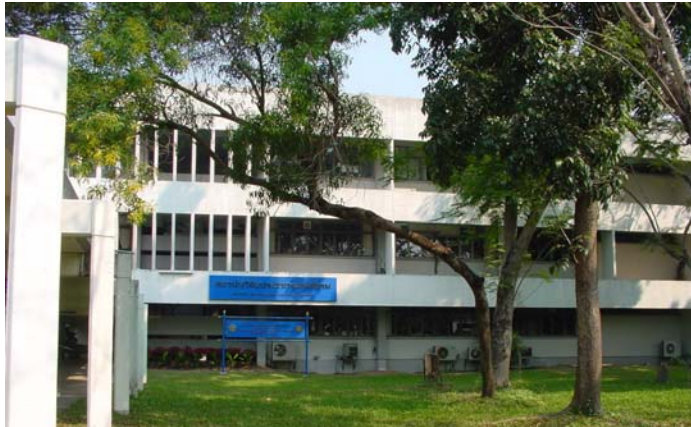
● อาคารสทววิจัยประชากรและสังคม

ที่ตั้งสถาบันวิจัยประชากรและสังคม มหาวิทยาลัยมหิดล ศาลายา