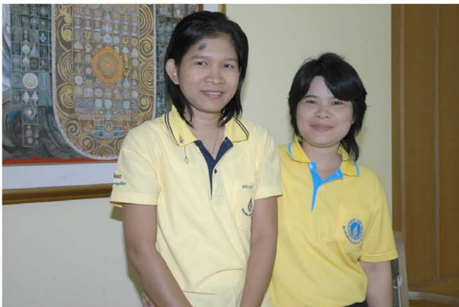
บุคลากรที่ได้รับรางวัลดีเด่นของสถาบันฯ