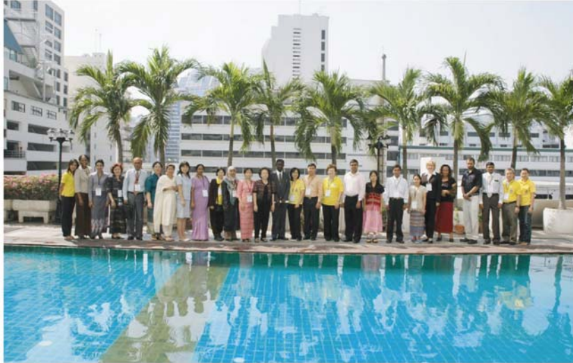
The MEASURE Evaluation Project, U.S.A. ให้ทุนสนับสนุนในการจัดอบรมเชิงปฏิบัติการเรื่อง Monitoring and Evaluation of Population, Health and Nutrition Programs ระหว่างวันที่ 30 ตุลาคม-17 พฤศจิกายน 2549