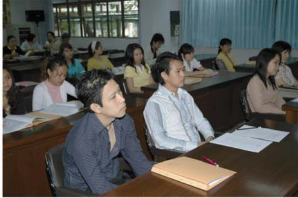
งานปฐมนิเทศนักศึกษา หลักสูตรศิลปศาสตรมหาบัณฑิต สาขาวิชาวิจัยประชากรและสังคม และหลักสูตรปรัชญาดุษฎีบัณฑิต สาขาวิชาประชากรศาสตร์ (หลักสูตรนานาชาติ) ในวันที่ 3 พฤษภาคม 2550