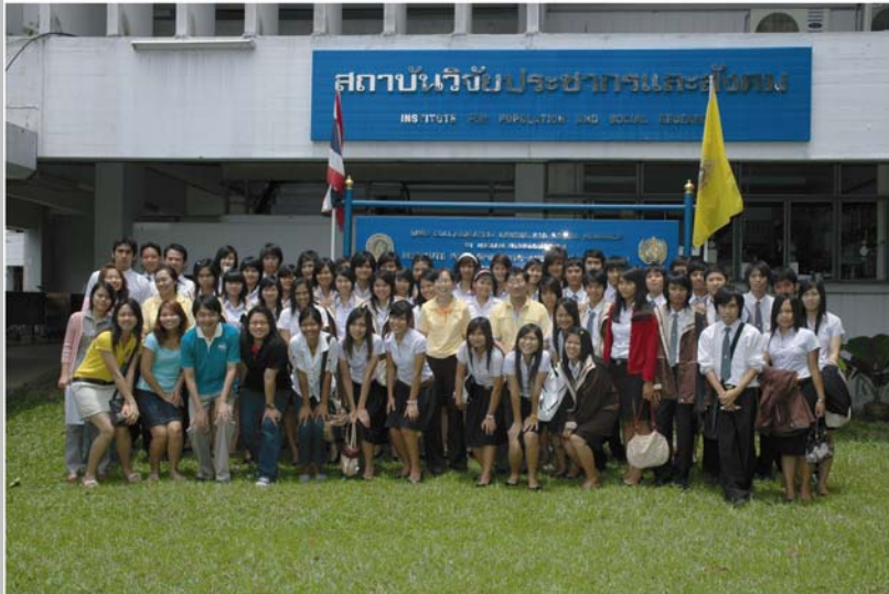
คณาจารย์และนิสิต สาขาวิจัยสังคม คณะสังคมศาสตร์ มหาวิทยาลัยนเรศวร มาฟังคำบรรยาย และศึกษาดูงานด้านการวิจัยของสถาบันฯ ในวันที่ 27 สิงหาคม 2550