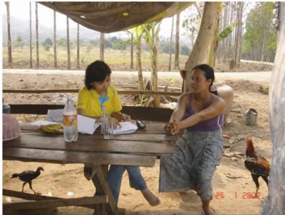
การวิจัยเรื่อง การย้ายถิ่นของพ่อแม่กับความอยู่ดีมีสุขของลูก