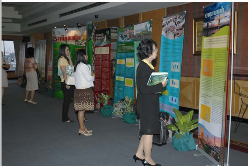
นิทรรศการในการประชุมวิชาการประจำปี "ประชากรและสังคม" ครั้งที่ 3 เรื่อง นคราภิวัดน์และวิถีชีวิตเมือง ในวันที่ 29 มิถุนายน 2550 ณ โรงแรมรอยัลริเวอร์