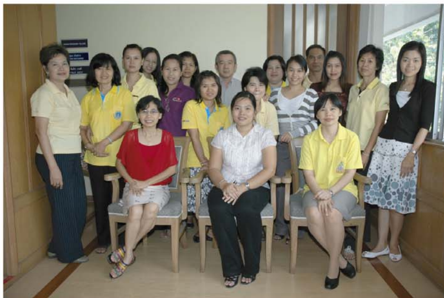
อบรมโครงการพัฒนาบุคลากร เรื่อง “การจัดการข้อมูลด้วยโปรแกรม Access”