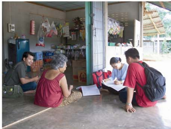
การวิจัยเรื่อง โครงการเฝ้าระวังทางประชากรกาญจนบุรี